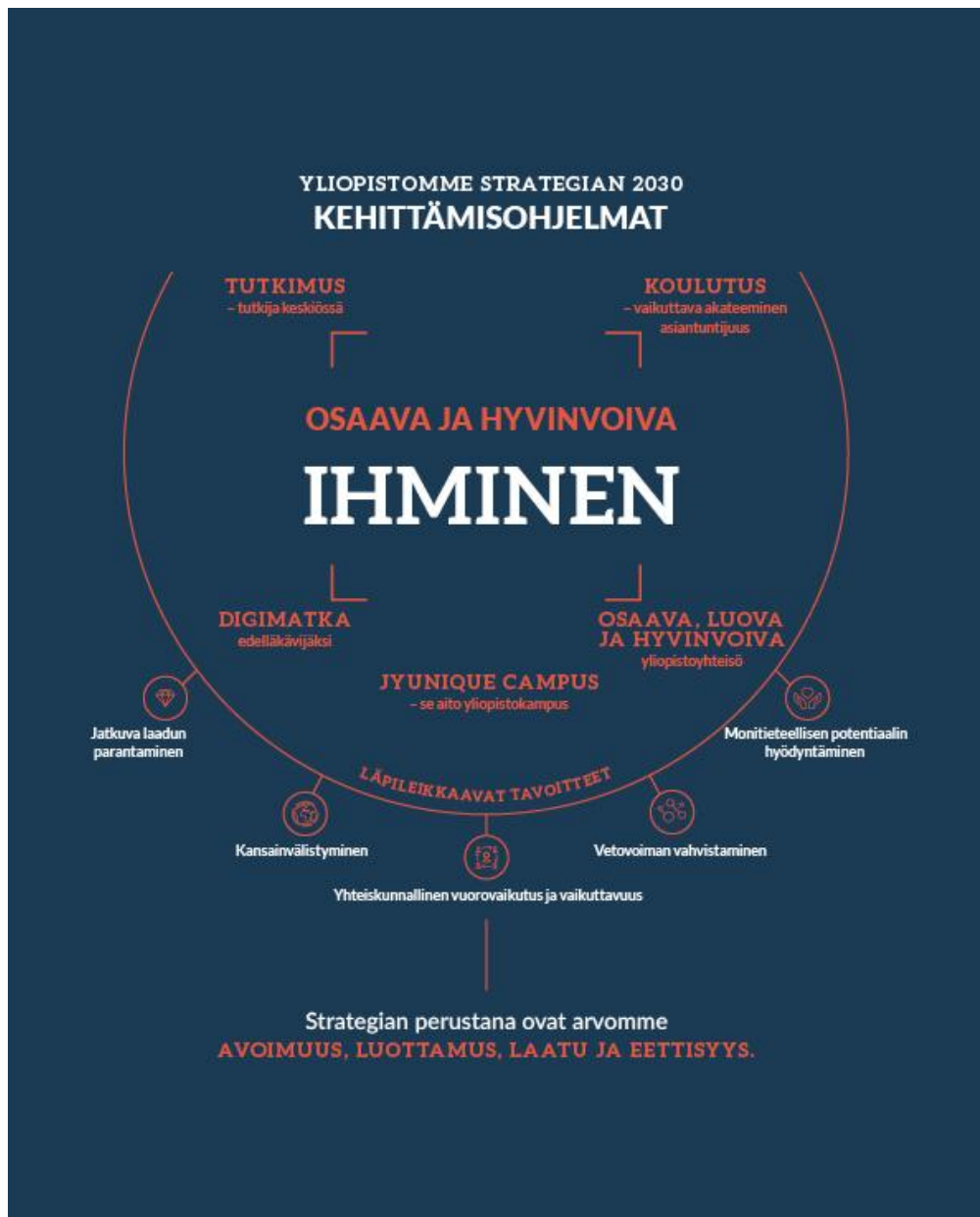
Kuvio 2 Jyväskylän yliopiston strategia 2030

Visiomme on olla oppimisen, hyvinvoinnin ja luonnon perusilmäiden aloilla yksi maailman johtavista tiedeyliopistoista sekä osaamisen ja kestävän yhteiskunnan uudistaja.