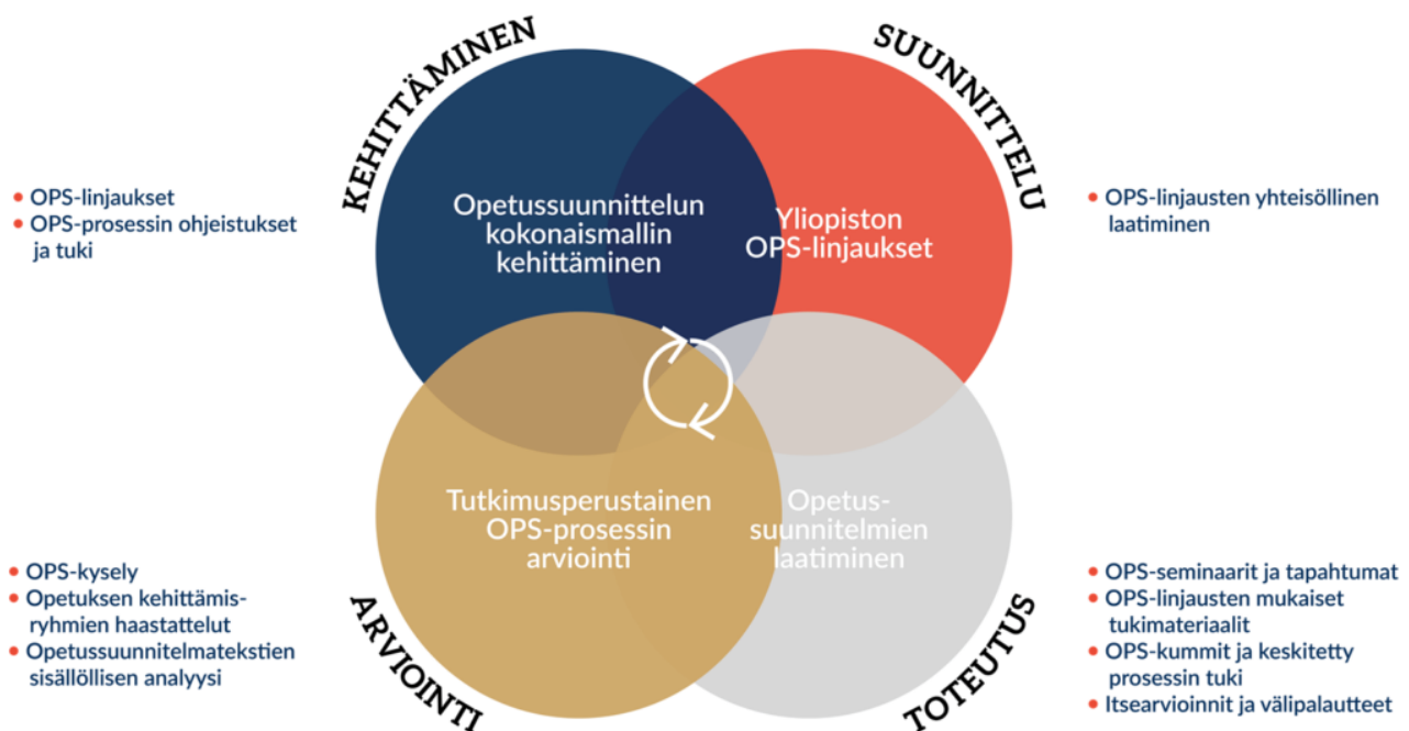
Kuvio 4 Jyväskylän yliopiston OPS-prosessin tutkimusperustainen kehittäminen

Osana OPS-työtä on myös kehitetty jatkuvan oppimisen toimintamallia, jonka tavoitteena on vastata osaamistarpeisiin elämän eri vaiheissa toisen asteen opiskelijoista seniorikansalaisiin. Yhtenä OPS-työn konkreettisista tavoitteista on ollut kehittää temaattisia moduuleja, joiden avulla mahdollistetaan nykyistä joustavampia ja yksilöllisemmät opintopolut tutkinto-opiskelijoille samalla kun luodaan pohja työelämässä toimivan aikuisväestön jatkuvan oppimisen tarpeisiin. Temaattisten moduulien tarjontaa sisältyy jo laajasti uusiin opetussuunnitelmiin.