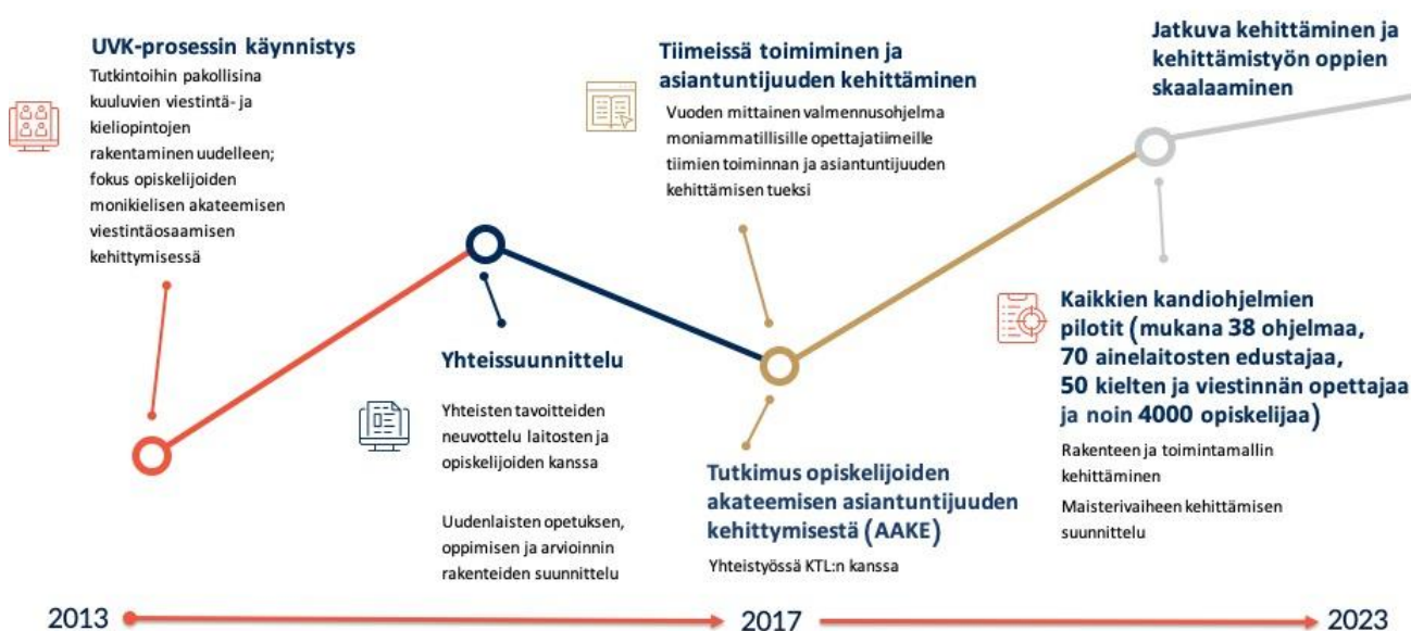
Kuvio 10 UVK-kehittämistyön eteneminen

Uusiutuvien kieli- ja viestintäopintojen kehittämisen pohjana on laitosrajat ylittävän yhteissuunnittelun ja jatkuvan kehittämisen periaate. Suunnittelussa ovat mukana laitoksen opiskelijat, tutorit, opetushenkilöstö ja hallintohenkilöstö. Jokaista tieteenalakohtaista viestintä- ja kieliopintojen kokonaisuutta varten on koottu Movin opettajista koostuvat opettajatiimit, jotka vastaavat opetuksen suunnittelusta ja toteutuksesta tiiviissä yhteistyössä ainelaitosten ja tiedekuntien kanssa. Suunnittelu on luonteeltaan moniammatillista yhteistyötä, jossa viestinnällisten ja kielitaitoon liittyvien oppimistarpeiden määrittelyssä opiskelijat ja opetushenkilöstö ovat avainasemassa. Ainelaitoksen opiskelijat ja edustajat tuovat yhteissuunnitteluun asiantuntemuksensa tieteenalastaan, sen opiskelun vaiheista, asiantuntijuuden luonteesta ja kehittämisestä sekä työelämätarpeista. Opintoja kehitetään jatkuvasti muun muassa opiskelijapalautteen ja laitostapaamisten avulla.