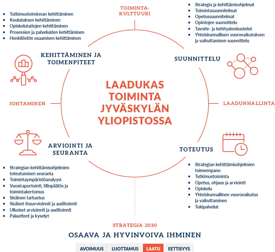
Kuvio 7 Jyväskylän yliopiston laatujohtamismalli

Yliopiston laadunhallinta on yhteisössä tunnetun vastuunjaon, hyviksi todettujen toimintatapojen ja käytänteiden sekä niihin kohdennettujen voimavarojen kokonaisuus. Laadunhallinnan menettelyin yliopisto ohjaa yhteisöään varmistamaan toiminnan laadun ja sen jatkuvan kehittämisen STAK-kehän (Suunnittelu–Toteutus–Arviointi–Kehittäminen) mukaisesti.