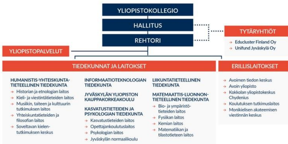
Kuvio 1 Jyväskylän yliopiston organisaatiokaavio

Yliopisto on organisoinut toimintansa kuuteen tiedekuntaan. Lisäksi yliopistossa on viisi erillislaitosta. Tukipalvelut on organisoitu yliopistopalveluihin. Yliopistoa johtavat hallitus ja rehtori vararehtoreineen.