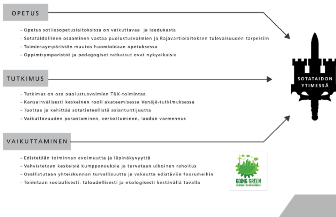
Kuva 2: Maanpuolustuskorkeakoulun strategian 2025 päätavoitteet

”Tutkitulla tiedolla ja innovatiivisella opetuksella tulevaisuuden sotataidon ytimessä”