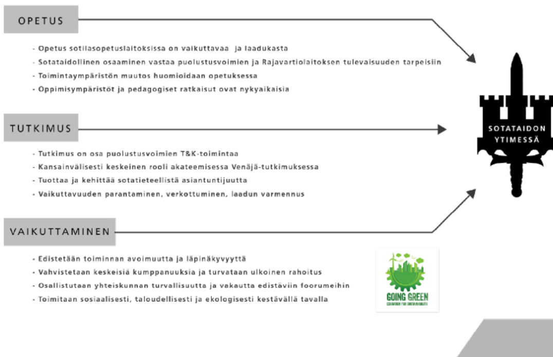
Kuva 2: Maanpuolustuskorkeakoulun strategian 2025 päätavoitteet

”Tutkitulla tiedolla ja innovatiivisella opetuksella tulevaisuuden sotataidon ytimessä”