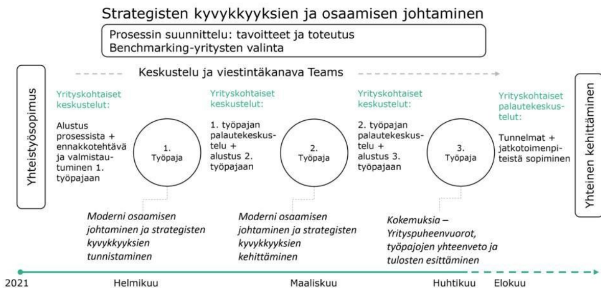
Kuva 5. Vertaisoppimisen prosessi

Vertaisoppiminen toteutettiin kolmena etä- ja hybridityöpajana keväällä 2021. Ennen niitä käytiin sitoutumista edistävät yrityskohtaiset alustuskeskustelut. Työpajoihin osallistuivat KPY:stä hallituksen puheenjohtaja, Genelecistä toimitusjohtaja ja kehitysjohtaja, Mehiläisestä yksikön johtaja sekä Savoniasta hallinto- ja henkilöstöjohtaja ja neljä muuta henkilöä. Teemoitetuissa työpajoissa keskusteltiin alustusten ja välitehtävien pohjalta. Sparrauspuheenvuoron piti Vincit Oyj:n edustaja. Osallistujien käytössä oli Teams-alusta. Prosessin jälkeen käytiin yrityskohtaiset palautekeskustelut.