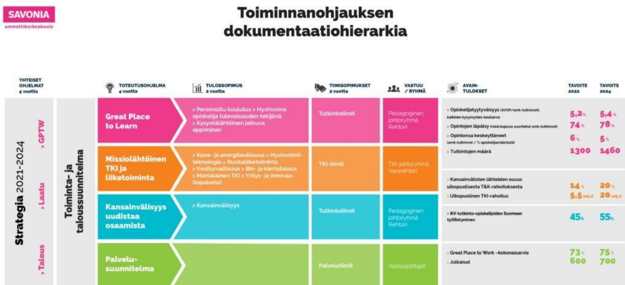
Kuva 4. Toiminnanohjauksen dokumentaatiohierarkia

Savoniassa laatu tarkoittaa tarkoituksenmukaista, perusteltua sekä hallittua toimintaa, jota arvioidaan ja kehitetään jatkuvasti. Toimintaa ja kehittämistä ohjaavat tavoitteet asetetaan strategiassa, sitä täydentävissä talous-, henkilöstö- sekä laatuohjelmissa ja sekä strategiasta johdetuissa toteutusohjelmissa. Strategian jalkauttaminen sekä tuloksikko- ja tiimikohtaiset tavoitteet määritellään tulos- ja tiimisopimuksissa. Tavoitteiden saavuttaminen varmistetaan toiminnanohjausjärjestelmän avulla. Järjestelmä luo rakenteet ja määrittää vastuut ja menettelytavat hyvin toimivalle laadunhallinnalle. Toiminnanohjausjärjestelmän tehtävänä on varmistaa laadukas ja tehokas toiminta sekä asetettujen tavoitteiden saavuttaminen. Toiminnanohjausjärjestelmän dokumentaatioalustana toimii henkilöstön intranet Santra. Santra sisältää kuvaukset toiminnanohjauksen kokonaisuudesta, organisaatorakenteeseen liittyvistä valta- ja vastuusuhteista sekä toimintaa ohjaavat kuvaukset ja ohjeet. Teams-järjestelmän laajamittaisen käyttöönoton myötä laadunhallintaan kytkeytyvien järjestelmien välinen suhde tulisi määritellä tarkasti. Myös järjestelmäintegraatiota tulee tältä pohjalta kehittää.