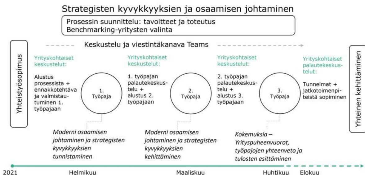
Kuva 5. Vertaisoppimisen prosessi

Vertaisoppiminen toteutettiin kolmena etä- ja hybridityöpajana keväällä 2021. Ennen niitä käytiin sitoutumista edistävät yrityskohtaiset alustuskeskustelut. Työpajoihin osallistuivat KPY:stä hallituksen puheenjohtaja, Genelecistä toimitusjohtaja ja kehitysjohtaja, Mehiläisestä yksikön johtaja sekä Savoniasta hallinto- ja henkilöstöjohtaja ja neljä muuta henkilöä. Teemoitetuissa työpajoissa keskusteltiin alustusten ja välitehtävien pohjalta. Sparrauspuheenvuoron piti Vincit Oyj:n edustaja. Osallistujien käytössä oli Teams-alusta. Prosessin jälkeen käytiin yrityskohtaiset palautekeskustelut.