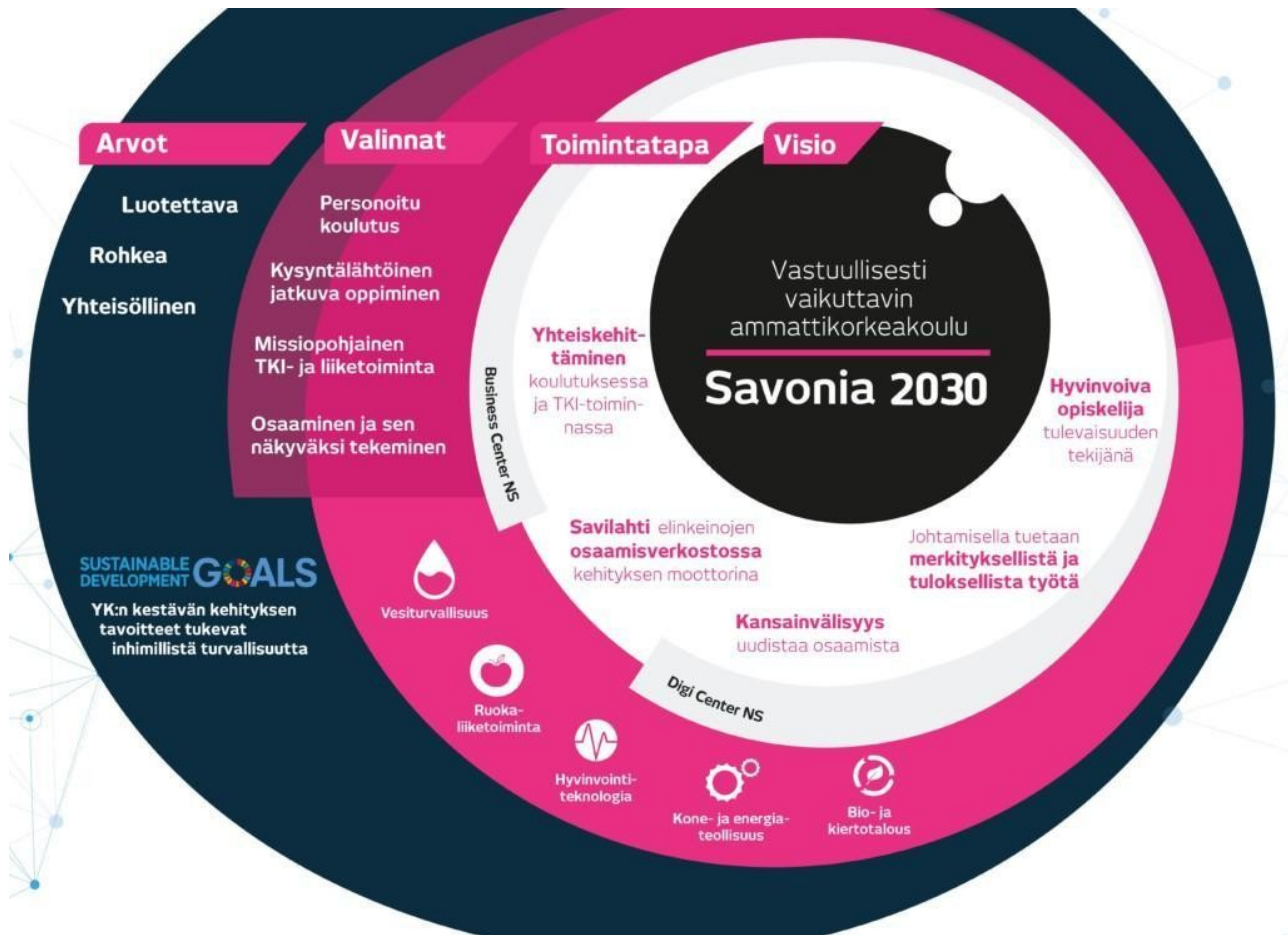
Kuva 2. Savonian strategia 2021-2030