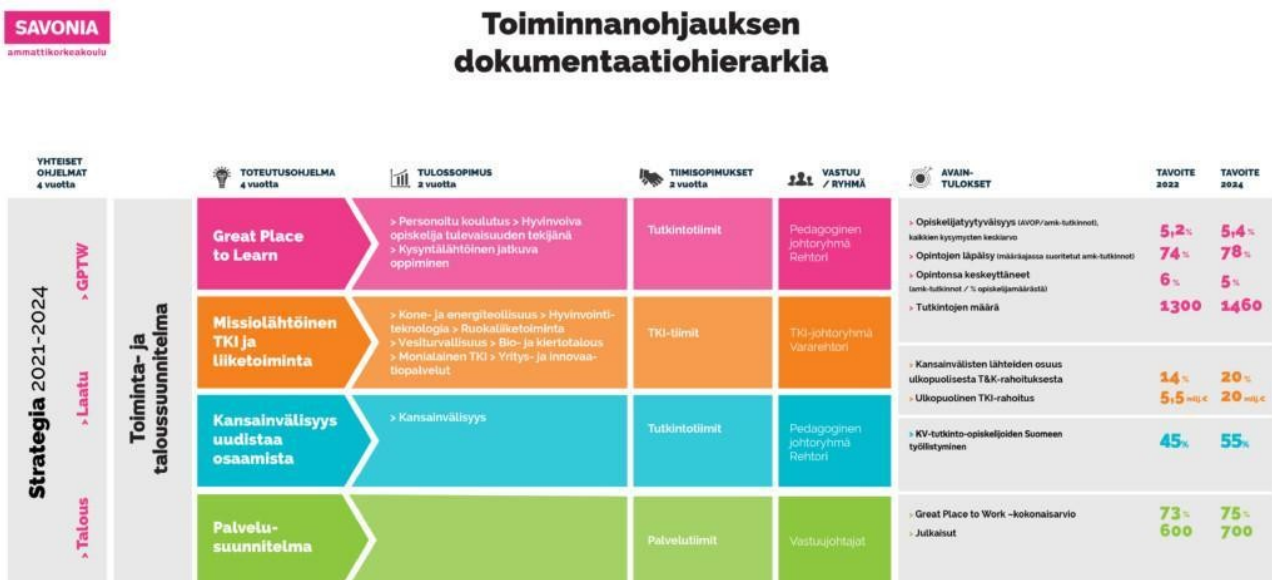
Kuva 4. Toiminnanohjauksen dokumentaatiohierarkia

Savoniassa laatu tarkoittaa tarkoituksenmukaista, perusteltua sekä hallittua toimintaa, jota arvioidaan ja kehitetään jatkuvasti. Toimintaa ja kehittämistä ohjaavat tavoitteet asetetaan strategiassa, sitä täydentävissä talous-, henkilöstö- sekä laatuohjelmissa ja sekä strategiasta johdetuissa toteutusohjelmissa. Strategian jalkauttaminen sekä tuloksikkö- ja tiimikohtaiset tavoitteet määritellään tulos- ja tiimisopimuksissa. Tavoitteiden saavuttaminen varmistetaan toiminnanohjausjärjestelmän avulla. Järjestelmä luo rakenteet ja määrittää vastuut ja menettelytavat hyvin toimivalle laadunhallinnalle. Toiminnanohjausjärjestelmän tehtävänä on varmistaa laadukas ja tehokas toiminta sekä asetettujen tavoitteiden saavuttaminen. Toiminnanohjausjärjestelmän dokumentaatioalustana toimii henkilöstön intranet Santra. Santra sisältää kuvaukset toiminnanohjauksen kokonaisuudesta, organisaatorakenteeseen liittyvistä valta- ja vastuusuhteista sekä toimintaa ohjaavat kuvaukset ja ohjeet. Teams-järjestelmän laajamittaisen käyttöönoton myötä laadunhallintaan kytkeytyvien järjestelmien välinen suhde tulisi määritellä tarkasti. Myös järjestelmäintegraatiota tulee tältä pohjalta kehittää.