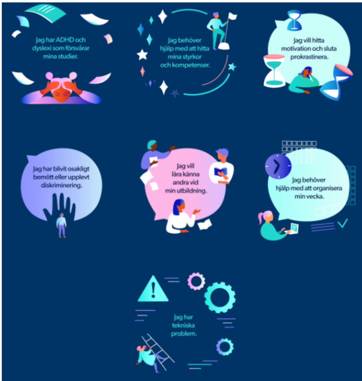
Figur 5: Stödnätverk för studerandenas välmående