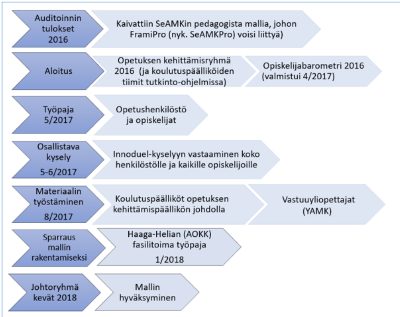
Kuvio 1. Oppiminen SeAMKissa -pedagogisen mallin (2018) rakentaminen.