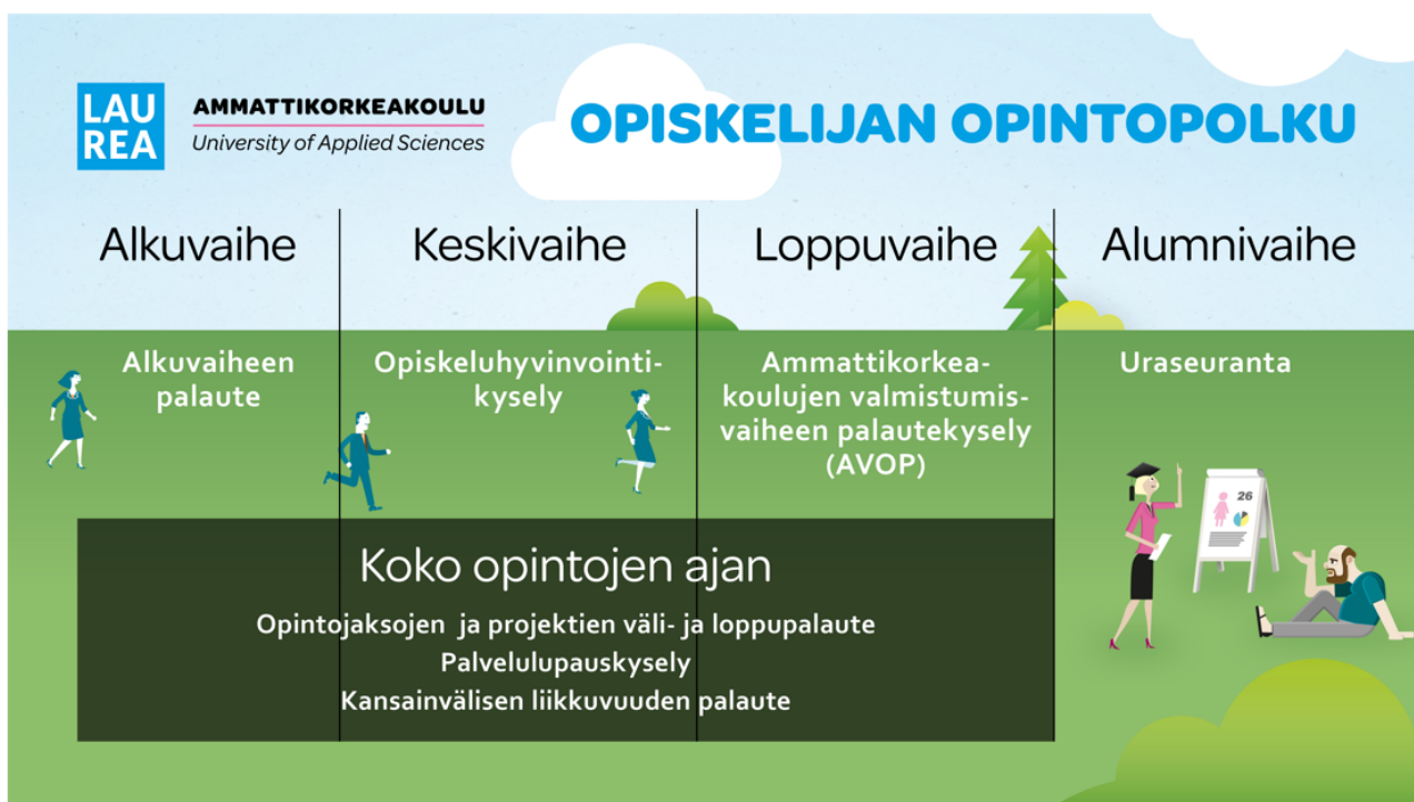
Kuva 5. Laurean opiskelijapalautejärjestelmä

Opiskelijapalautejärjestelmä koostuu opintojakso-/projektikohtaisesta väli- ja loppupalautteesta, alkuvaiheen palautteesta, opiskeluhyvinvointipalautteesta, palvelulupauspalautteesta sekä kansallisesta valmistuvien palautteesta (AVOP). Lisäksi palautetta kerätään kansainvälisestä liikkuvuudesta. Laurea on myös mukana kansallisessa uraseurannassa. Kuvassa 5 on kuvattu Laurean opiskelijapalautejärjestelmä.