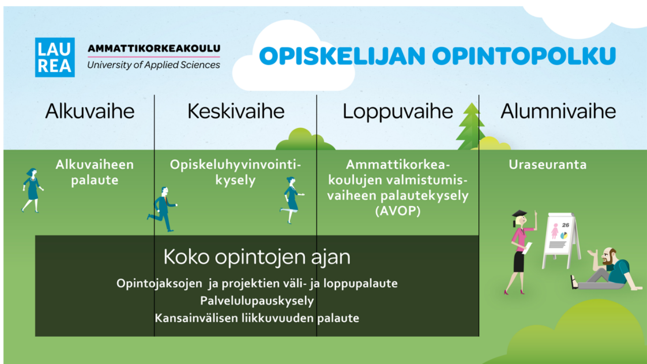
Kuva 5. Laurean opiskelijapalautejärjestelmä

Opiskelijapalautejärjestelmä koostuu opintojakso-/projektikohtaisesta väli- ja loppupalautteesta, alkuvaiheen palautteesta, opiskeluhyvinvointipalautteesta, palvelulupauspalautteesta sekä kansallisesta valmistuvien palautteesta (AVOP). Lisäksi palautetta kerätään kansainvälisestä liikkuvuudesta. Laurea on myös mukana kansallisessa uraseurannassa. Kuvassa 5 on kuvattu Laurean opiskelijapalautejärjestelmä.