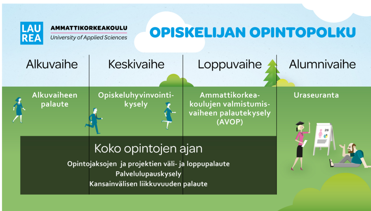
Kuva 5. Laurean opiskelijapalautejärjestelmä

Opiskelijapalautejärjestelmä koostuu opintojakso-/projektikohtaisesta väli- ja loppupalautteesta, alkuvaiheen palautteesta, opiskeluhyvinvointipalautteesta, palvelulupauspalautteesta sekä kansallisesta valmistuvien palautteesta (AVOP). Lisäksi palautetta kerätään kansainvälisestä liikkuvuudesta. Laurea on myös mukana kansallisessa uraseurannassa. Kuvassa 5 on kuvattu Laurean opiskelijapalautejärjestelmä.