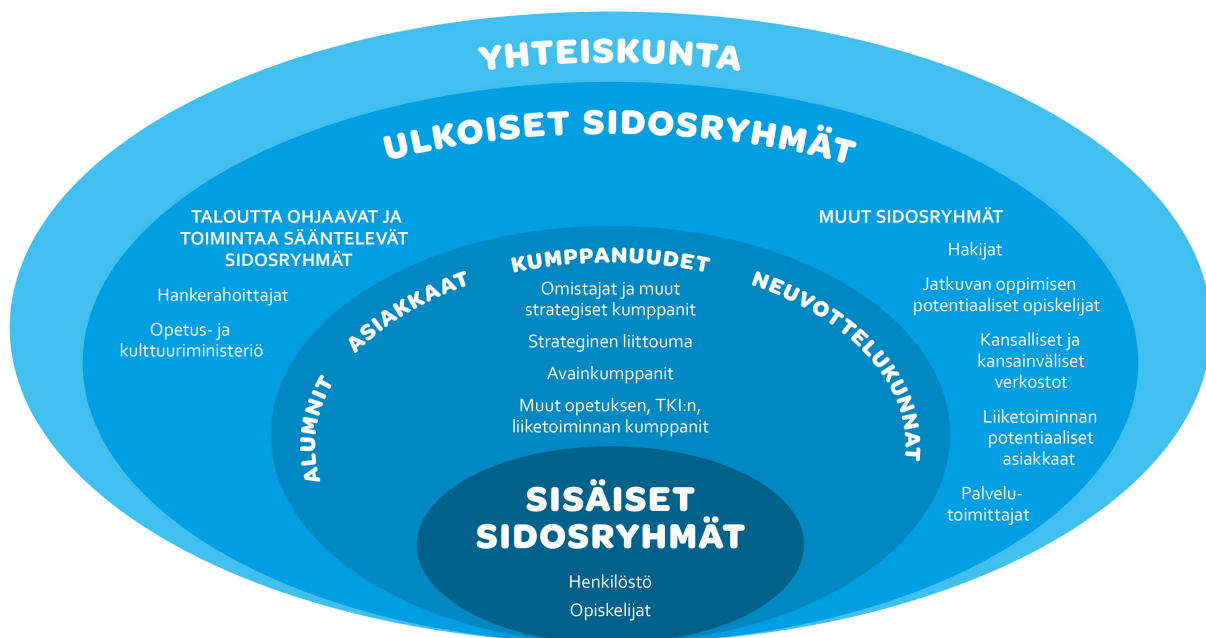
Kuva 6. Laurean sidosryhmäluokittelu

Sidosryhmien nousevia tarpeita ja muita toimintaympäristön heikkoja signaaleja tunnistetaan aktiivisesti ja toimintaa myös mukautetaan niiden mukaisesti esim. uusien TKI-hankkeiden tai opintosisältöjen kautta. Kuvassa 6 on esitetty Laurean sidosryhmäluokittelu.