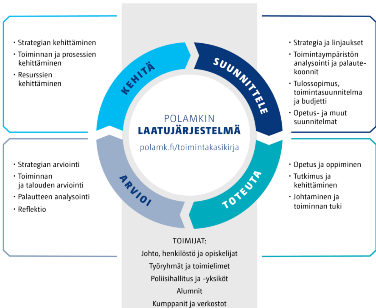
Kuva 2. Poliisiammattikorkeakoulun laatujärjestelmä perustuu jatkuvaan kehittämiseen.