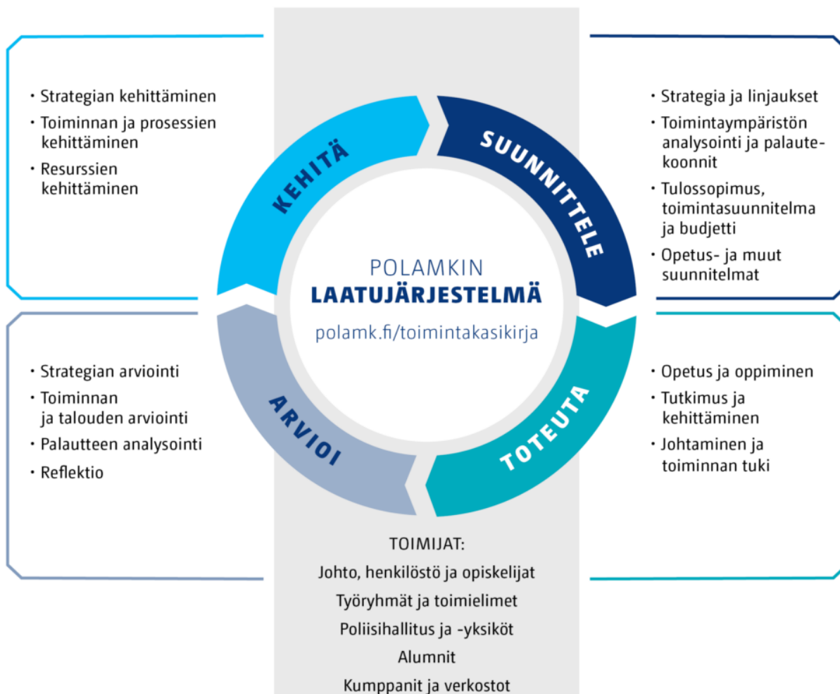
Kuva 2. Poliisiammattikorkeakoulun laatujärjestelmä perustuu jatkuvaan kehittämiseen.