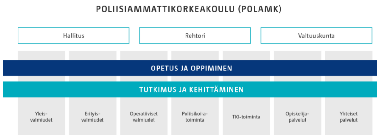
Kuva 3. Nykyinen organisaatiomme.

Projektiryhmät selvittivät nykyisen organisaatiomme (kuva 3) kehittämistarpeita vuosina 2019 ja 2023.