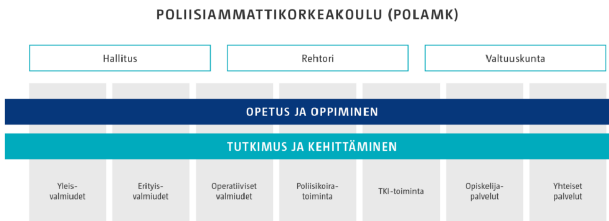
Kuva 3. Nykyinen organisaatiomme.

Projektiryhmät selvittivät nykyisen organisaatiomme (kuva 3) kehittämistarpeita vuosina 2019 ja 2023.