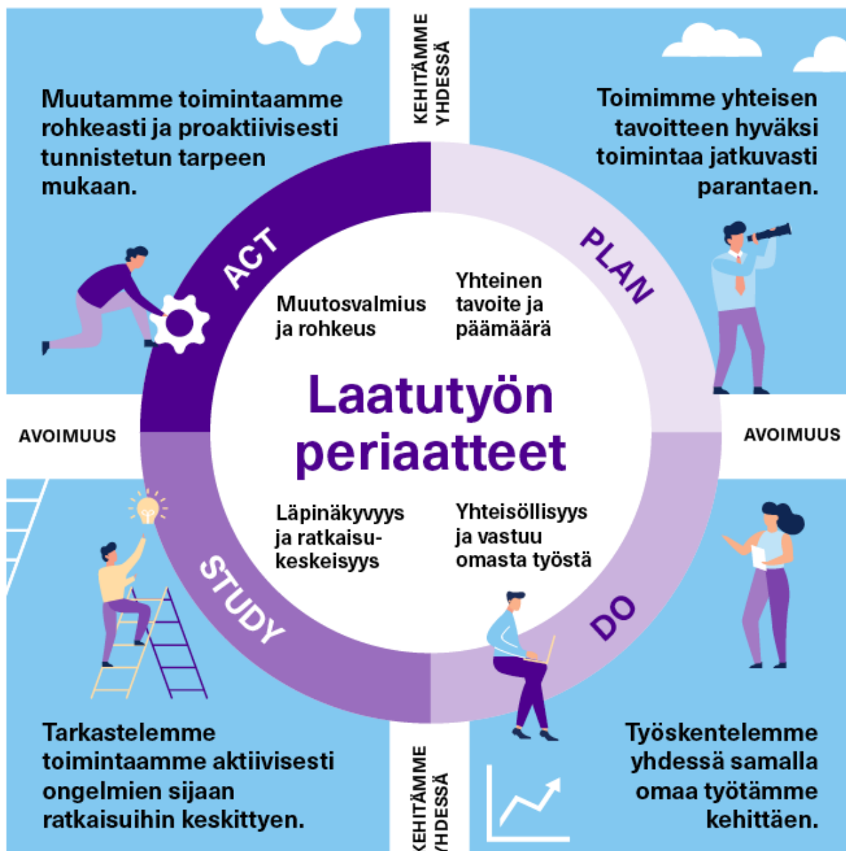
Kuvio 7. Laatutyön periaatteet

Henkilöstö ja opiskelijat osallistuvat kehittämiseen monin tavoin, kuten työryhmien ja päätöksentekuelinten kautta (ks. esim. työryhmät , joissa Tamko mukana). Esimerkiksi laatutyöryhmällä on tärkeä vakiintunut rooli osallistumisen kanavana. Se on toiminut vuodesta 2010 lähtien, ja siinä on yksiköiden, Tamkon ja opiskelijoiden edustus. Ryhmä toimii laatujärjestelmää ja sen kehittämistä arvioivana, koordinoivana, valmistelevana ja tukevana asiantuntijatyöryhmänä.