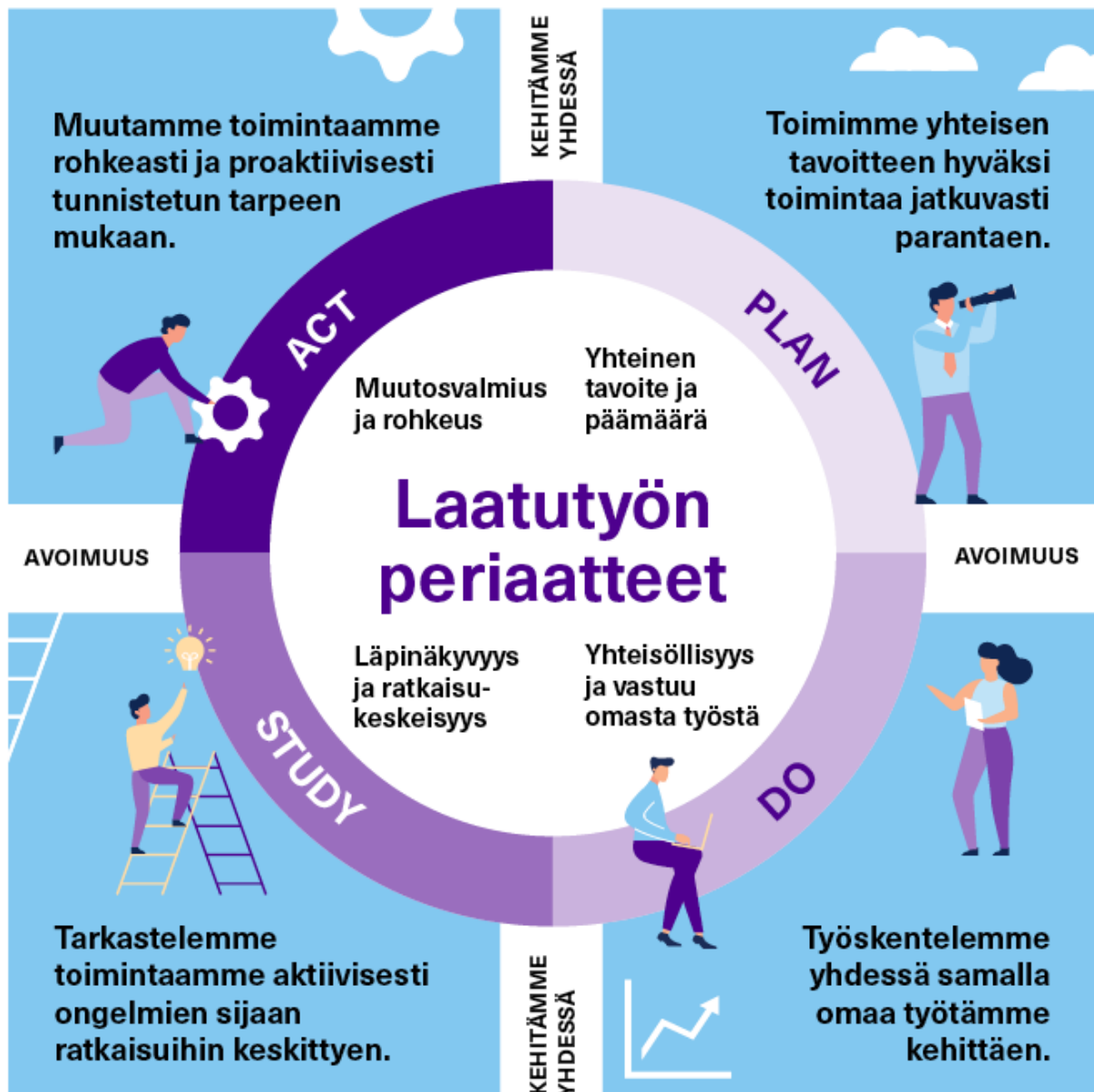
Kuvio 7. Laatutyön periaatteet

Henkilöstö ja opiskelijat osallistuvat kehittämiseen monin tavoin, kuten työryhmien ja päätöksentekuelinten kautta (ks. esim. työryhmät , joissa Tamko mukana). Esimerkiksi laatutyöryhmällä on tärkeä vakiintunut rooli osallistumisen kanavana. Se on toiminut vuodesta 2010 lähtien, ja siinä on yksiköiden, Tamkon ja opiskelijoiden edustus. Ryhmä toimii laatujärjestelmää ja sen kehittämistä arvioivana, koordinoivana, valmistelevana ja tukevana asiantuntijatyöryhmänä.