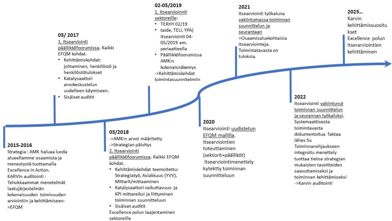
Kuvio 11. Laatujärjestelmän kehittämisen tärkeimmät vaiheet

Kehittämistarpeita nousee esiin palautteista, sisäisistä ja ulkoisista arvioinneista, jotka ovat laatujärjestelmän toimivuutta todentavia ja kehittäviä menettelyitä. Karvin kehittävä auditointi on keskeinen menettely omien vahvuuksien ja kehittämiskohtien havaitsemisessa ja priorisoinnissa.