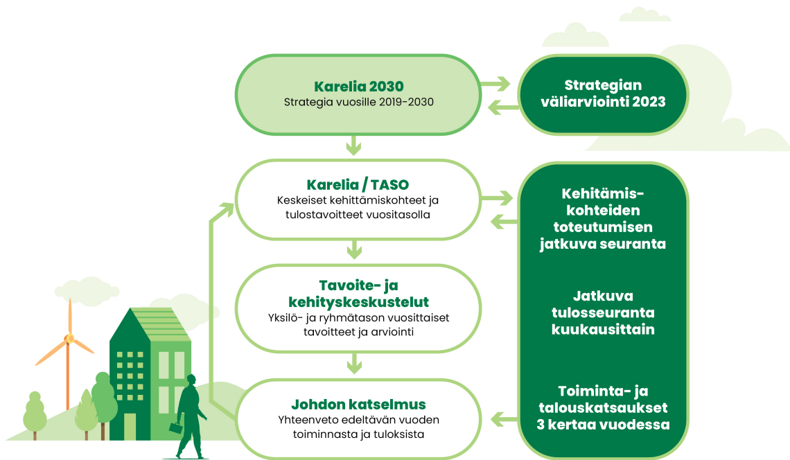
Kuvio 5. Karelia 2030 -strategian toteutus ja seuranta

työtehtäviin ja tuloksiin sekä oman osaamisen kehittämiseen liittyviin tavoitteisiin.