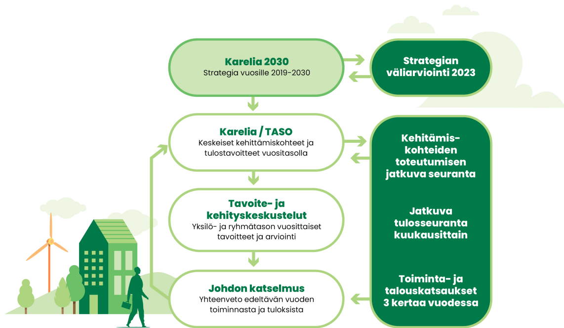
Kuvio 5. Karelia 2030 -strategian toteutus ja seuranta

työtehtäviin ja tuloksiin sekä oman osaamisen kehittämiseen liittyviin tavoitteisiin.