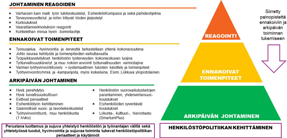
Kuvio 6: Taideyliopiston työhyvinvointitoiminnassa korostuvat ennakointi ja arkipäivän johtaminen

Työhyvinvointikysely ja työpaikkaselvitys tukevat työhyvinvointitoiminnan kehittämisessä. Yliopistojen yhteinen työhyvinvointikysely toteutetaan joka toinen vuosi. Yliopiston johto ja yksiköt käsittelevät tulokset ja kehittämistoimenpiteet kirjataan yhteiseen alustaan. Keskeiset havainnot huomioidaan osana yliopiston vuosiarviointia. Työterveyshuollon työpaikkaselvitys toteutetaan joka kolmas vuosi ja sen prosessiin sisältyvät sähköinen esikysely, työpaikkakäynnit, keskustelutilaisuudet tuloksista sekä kehittämistoimista sopiminen.