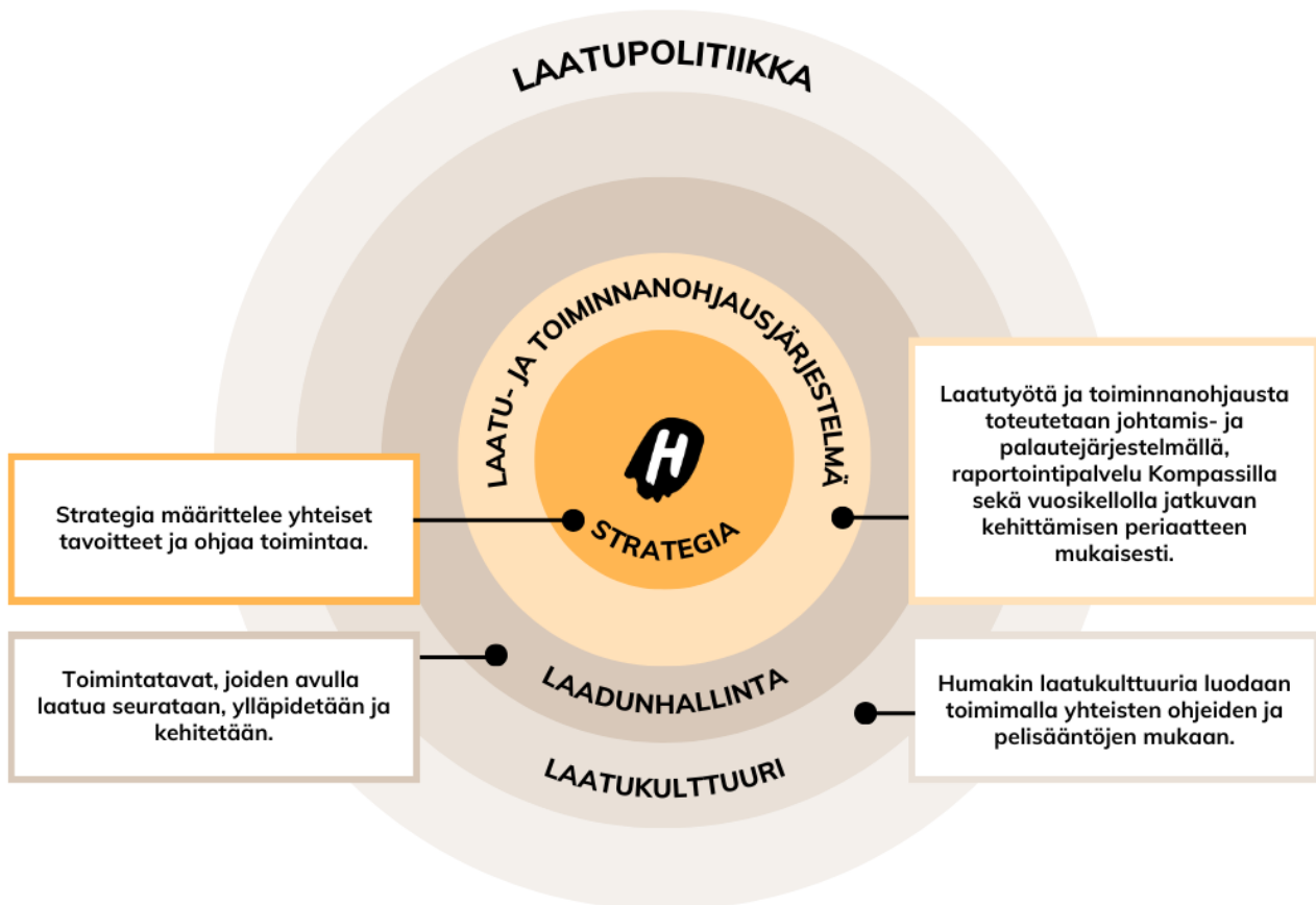
Kuvio 8. Humakin laatupolitiikka.

Humakissa laatu- ja toiminnanohjausjärjestelmä on kytketty kiinteäksi osaksi ammattikorkeakoulun johtamista ja toiminnanohjausta. Laatu- ja toiminnanohjausjärjestelmän tavoitteena on ohjata tekemistä ja tuottaa systemaattista tietoa toiminnan ja sen laadun kehittämiseksi sekä johtamisen tueksi, kehittää laadunhallinnan menettely- ja toimintatapoja sekä vahvistaa Humakin toimintakulttuuria ja tukea hyvien käytänteiden leviämistä (ks. kuvio 9). Keskiössä on Demingin PDCA-ympyrä, joka perustuu toiminnan jatkuvan kehittämisen periaatteelle: suunnittelu, toteutus, arviointi ja kehittäminen. Laatu- ja toiminnanohjaus pohjautuu ennakointiin, saadun tiedon analysointiin ja arviointiin sekä jatkuvaan parantamiseen ja oppimiseen. Keskeinen osa toiminnan suuntaamista on toimintaympäristön analyysi ja vaikuttavuuden arviointi.