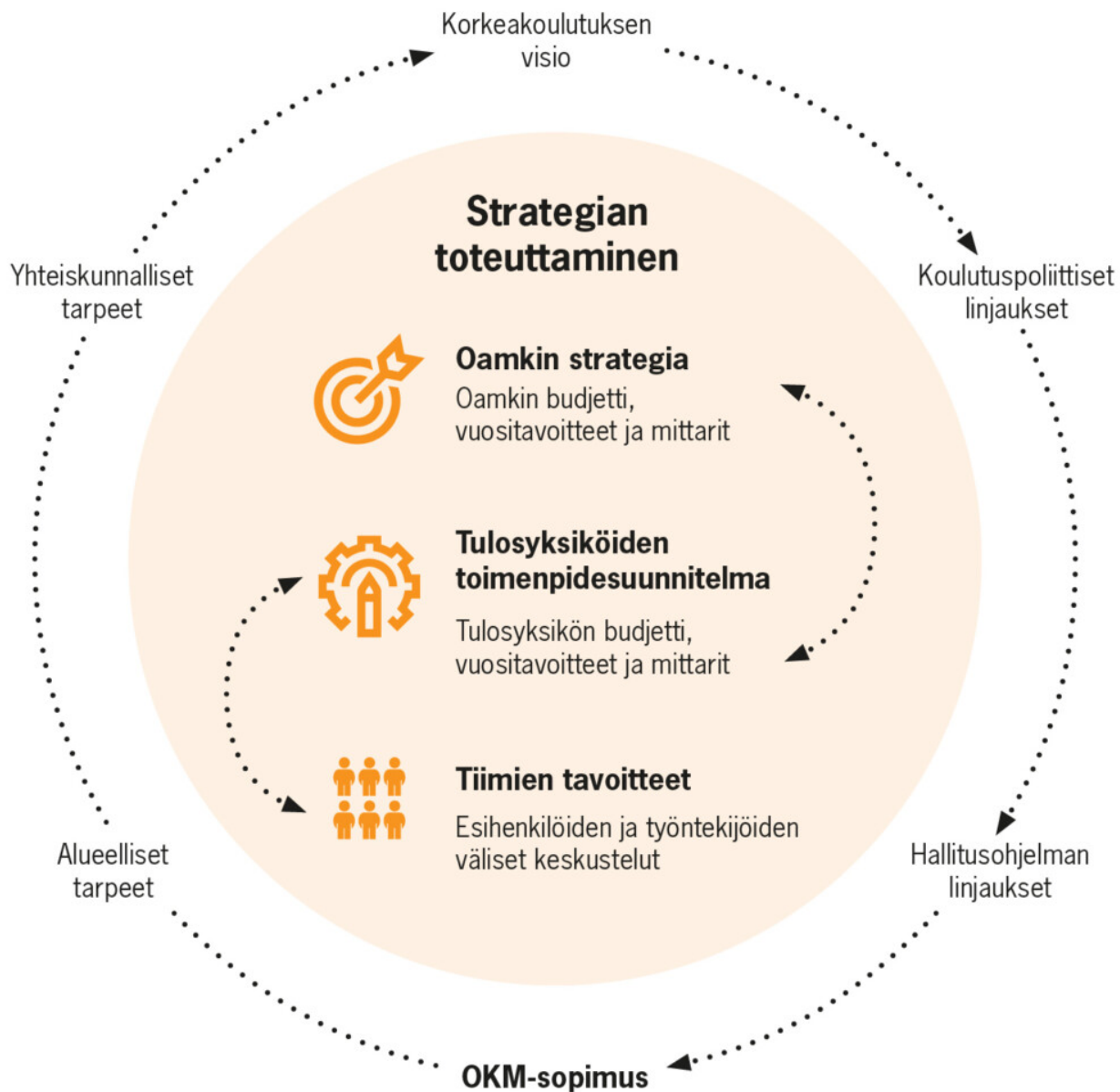
Kuva 18. Strategian toteuttaminen Oamkissa.

Tiimit toteuttavat tuloyksiköissä strategian toimenpidesuunnitelmia yhteisesti sovitulla tavoilla. Esihenkilön ja työntekijän välisissä keskusteluissa tarkastelemme tavoitteita henkilökohtaisella tasolla.