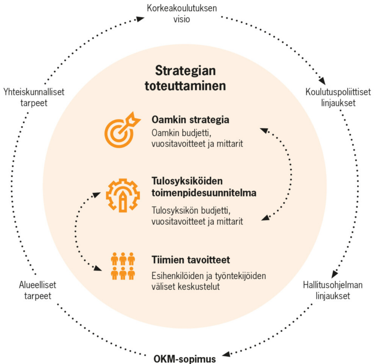
Kuva 18. Strategian toteuttaminen Oamkissa.

Tiimit toteuttavat tuloyksiköissä strategian toimenpidesuunnitelmia yhteisesti sovitulla tavoilla. Esihenkilön ja työntekijän välisissä keskusteluissa tarkastelemme tavoitteita henkilökohtaisella tasolla.