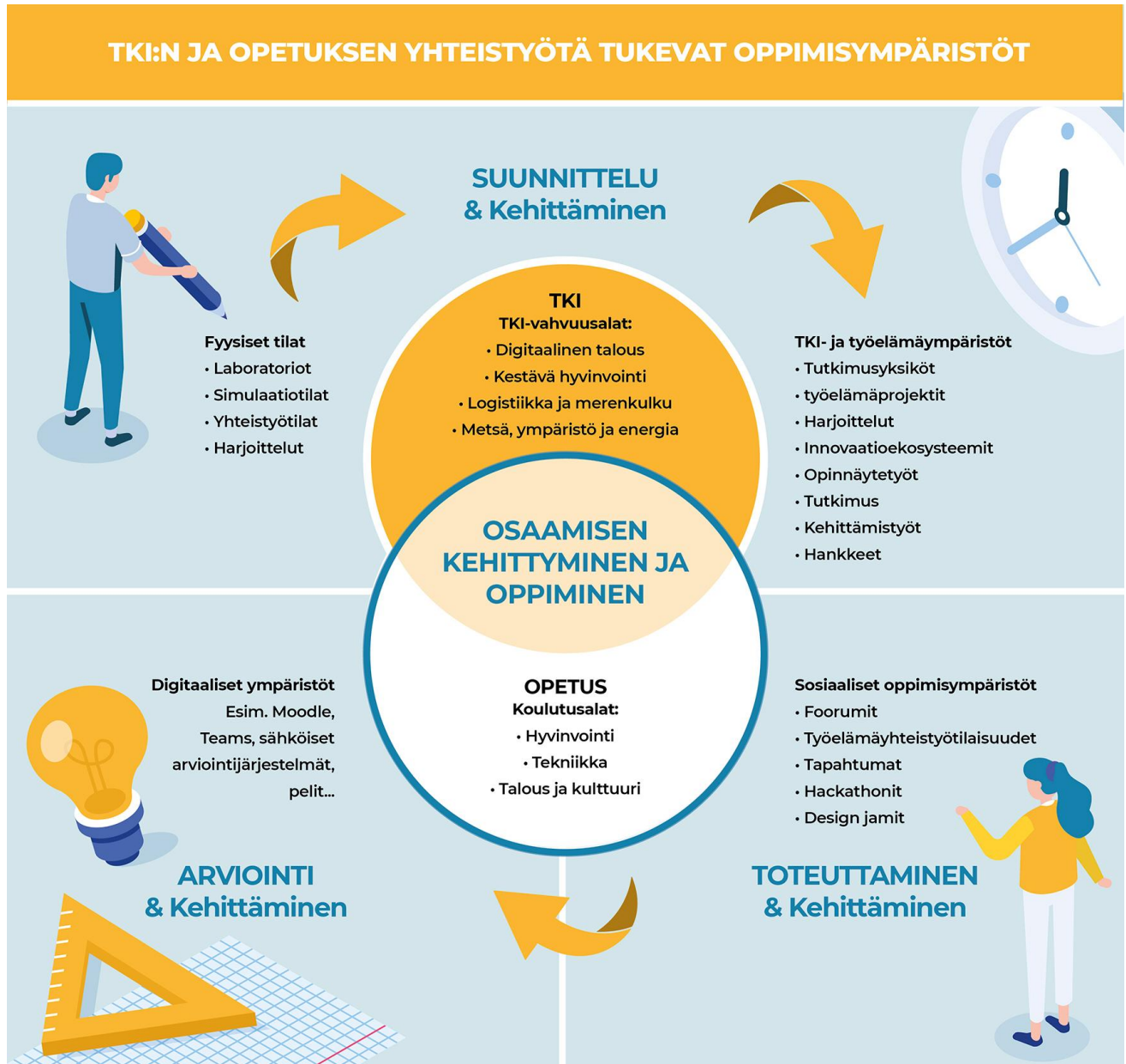
Kuva 16. TKI:n ja opetuksen yhteistyötä tukevat oppimisympäristöt Xamkissa

tuli yhdeksän, joista kriteereiden perusteella valittiin esiteltäväksi kolme. Valitut esimerkit ilmentävät monialaisia, jo toiminnassa olevia erityyppisiä toimintatapoja TKI:n ja opetuksen integraatiosta. Näiden lisäksi Xamkissa on useita hyviä koulutus- tai alakohtaisia TKI-oppimisympäristöjä.