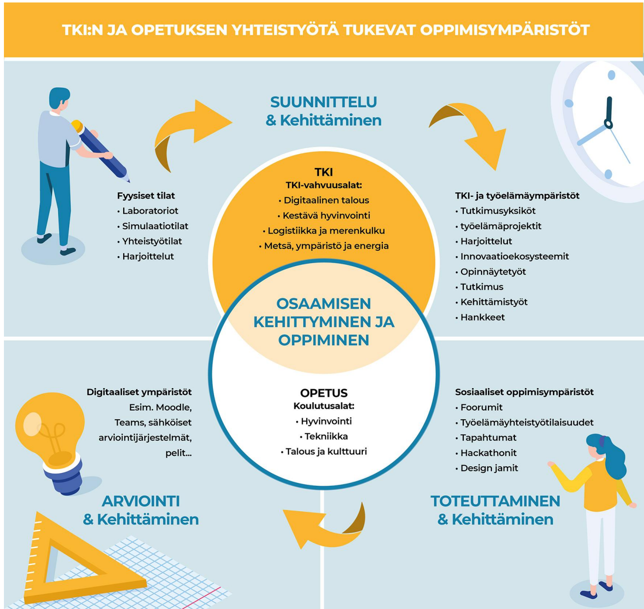
Kuva 16. TKI:n ja opetuksen yhteistyötä tukevat oppimisympäristöt Xamkissa

tuli yhdeksän, joista kriteereiden perusteella valittiin esiteltäväksi kolme. Valitut esimerkit ilmentävät monialaisia, jo toiminnassa olevia erityyppisiä toimintatapoja TKI:n ja opetuksen integraatiosta. Näiden lisäksi Xamkissa on useita hyviä koulutus- tai alakohtaisia TKI-oppimisympäristöjä.