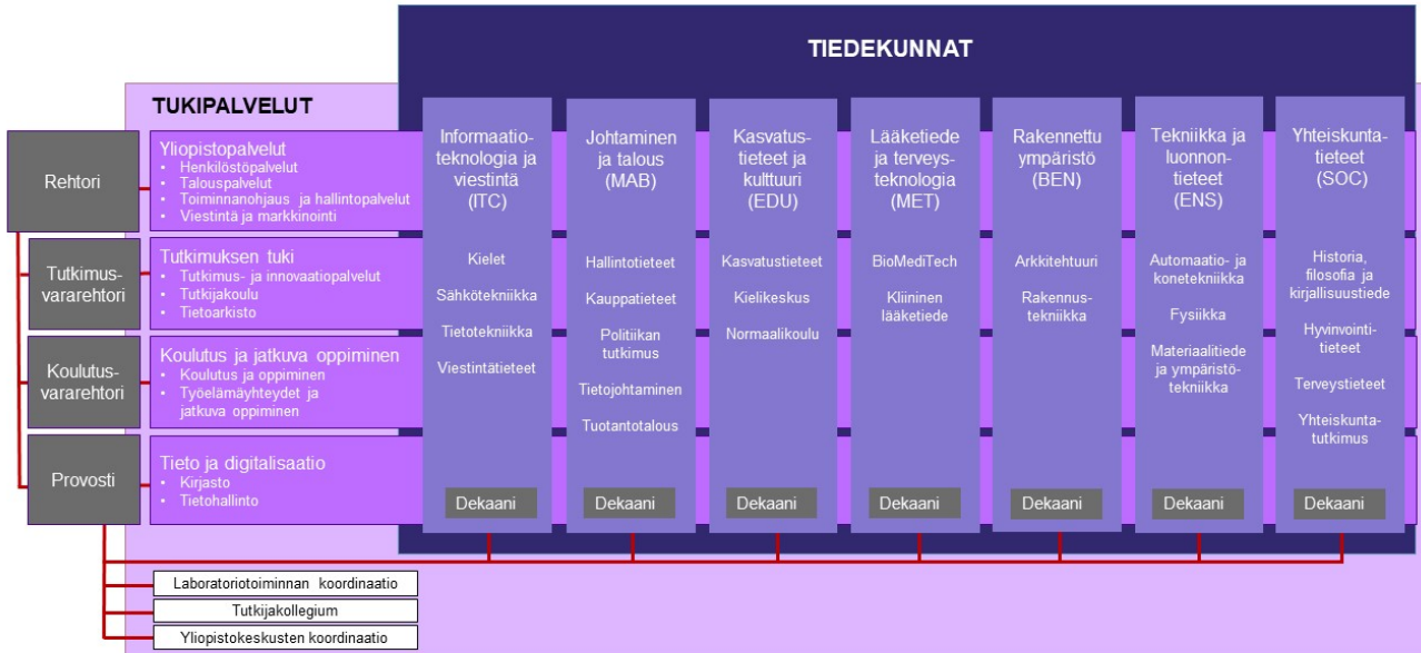
Kuvio 1. Tampereen yliopiston organisaatio.

Yliopiston toimielimiä ovat yliopistolain mukaisesti hallitus, rehtori, säätiöyliopiston yhteinen monijäseninen hallintoelin konsistori ja tiedekuntaneuvostot. Konsistorille asioita valmistelevat johtosäännön mukaiset koulutus-, tiede- ja yhteiskunnallisen vuorovaikuttamisen neuvostot. Rehtorilla on työnsä tukena johtoryhmä.