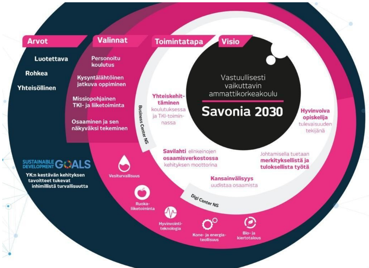
Kuva 2. Savonian strategia 2021-2030

Strategiassa näkökulmina on personoitu koulutus, kysyntälähtöinen jatkuva oppiminen, hyvinvoiva opiskelija, missiopohjainen TKI- ja liiketoiminta, kansainvälisyys uudistaa osaamista sekä johtamisella tuetaan merkityksellistä ja tuloksellista työtä. Savonia huomioi tehtäviä toteuttaessaan kestävän kehityksen tavoitteet ja siihen liittyen inhimillisen turvallisuuden (Human Security).