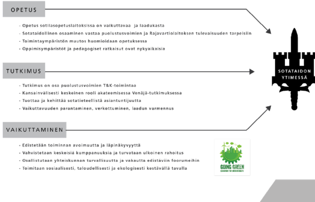
Kuva 2: Maanpuolustuskorkeakoulun strategian 2025 päätavoitteet

”Tutkitulla tiedolla ja innovatiivisella opetuksella tulevaisuuden sotataidon ytimessä”