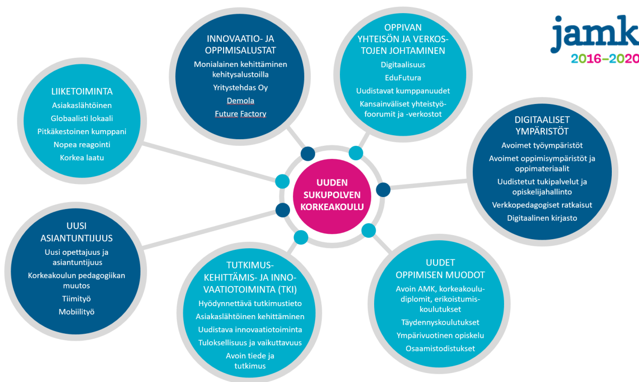
Kuvio 3. Uuden sukupolven korkeakoulu

JAMK on asettanut tavoitteekseen kehittyä vuoteen 2020 mennessä Uuden sukupolven korkeakouluksi , joka on digitaalinen ja virtuaalinen, monimuotoinen, yrittäjämäinen ja elinikäisen oppimisen mahdollistava kansainvälinen yhteisö. Uuden sukupolven korkeakoulun ominaispiirteitä on kuvattu kuviossa 3.