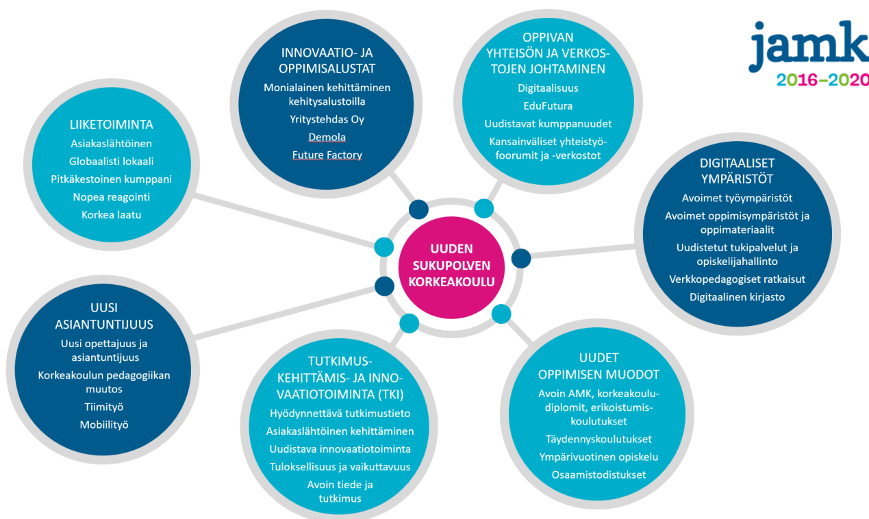
Kuvio 3. Uuden sukupolven korkeakoulu

JAMK on asettanut tavoitteekseen kehittyä vuoteen 2020 mennessä Uuden sukupolven korkeakouluksi , joka on digitaalinen ja virtuaalinen, monimuotoinen, yrittäjämäinen ja elinikäisen oppimisen mahdollistava kansainvälinen yhteisö. Uuden sukupolven korkeakoulun ominaispiirteitä on kuvattu kuviossa 3.