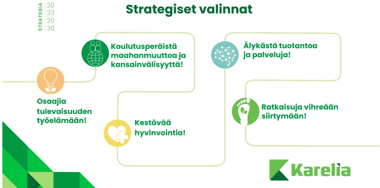
Kuvio 2. Karelian strategiset valinnat

Strategiassa on kuvattu kutakin strategista valintaa koskevat välitavoitteet eli metroradat. Metroradat kuvaavat strategisten valintojen välivaiheita ja -tavoitteita, joiden kautta strategisia valintoja toteutetaan. Strategiaa toteutetaan vuosittain laadittavan Karelia/TASO-sopimuksen avulla. Sopimukseen kirjattujen tulos- ja kehittämistavoitteiden toteutumista seurataan kolmannesvuosittain toiminta- ja talouskatsauksissa sekä vuositasolla johdon katselmuksessa. Strategian kokonaisuuden toteutumista seurataan kustakin strategisesta valinnasta laadittujen metroratojen sekä muutaman vuoden välein tapahtuvan strategian väliarvioinnin avulla. Viimeisin väliarviointi toteutettiin keväällä 2023.