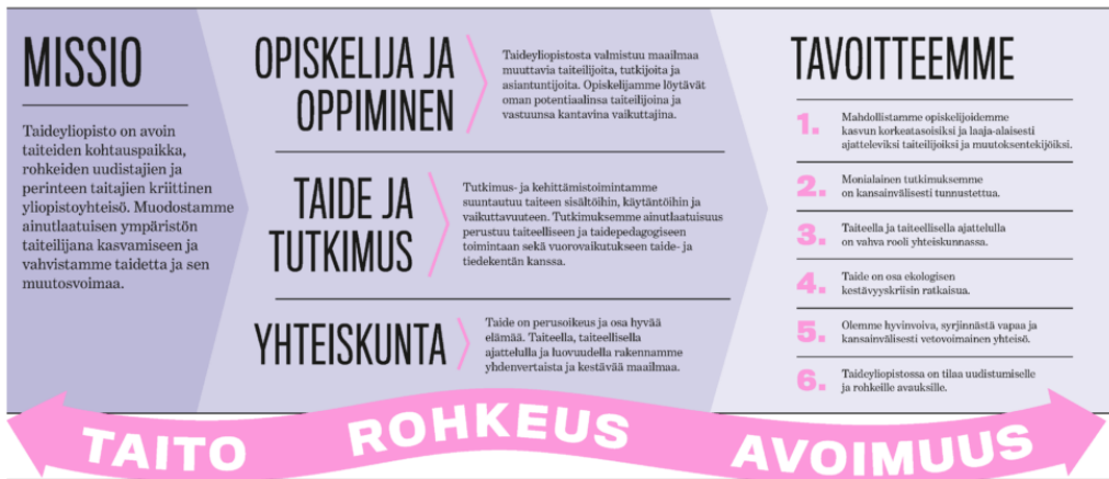
Kuvio 2: Taideyliopiston strategia