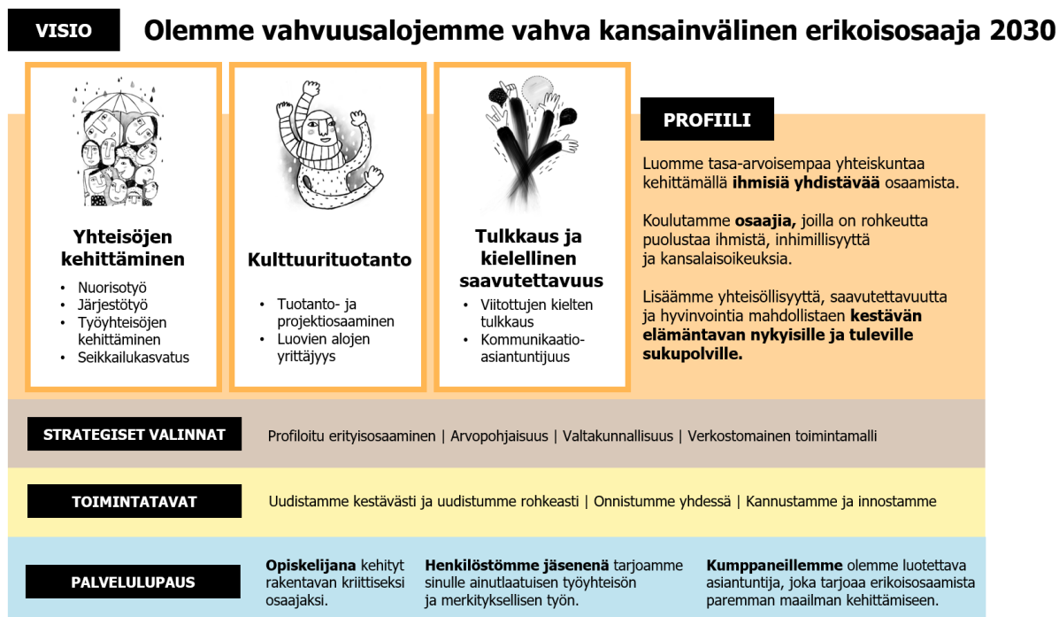
Kuvio 3. Humakin strategia.

Visionsa mukaisesti Humak haluaa olla vahva kansainvälinen osaaja vuonna 2030 omilla osaamisalueillaan (ks. kuvio 3). Keväällä 2023 käynnistettiin strategian päivitystyö siten, että päivitetty strategia otetaan käyttöön 1.1.2025. Päivitystyön tavoitteena on Humakin profiilin kirkastaminen ja yhteiskunnallisen vaikuttavuuden sekä vuorovaikutuksen vahvistaminen.