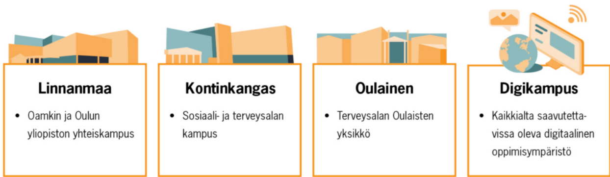
Kuva 1. Opetusta annamme fyysisesti kolmella kampuksella, minkä lisäksi toimimme digitaalisessa oppimisympäristössä.