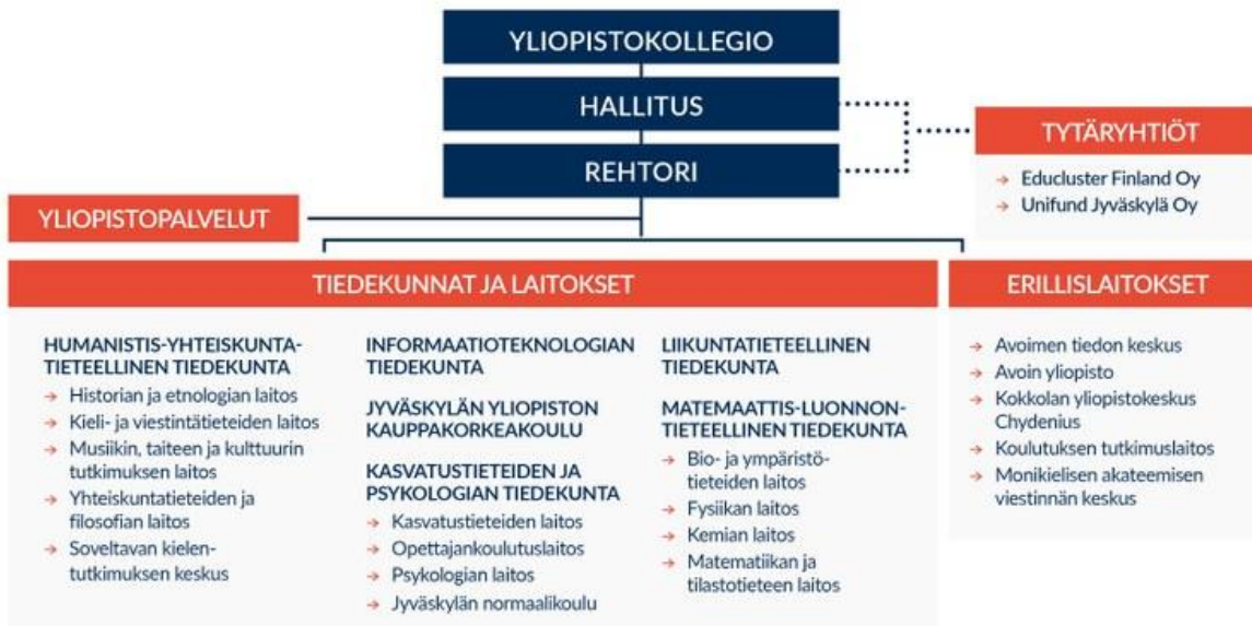
Kuvio 1 Jyväskylän yliopiston organisaatiokaavio