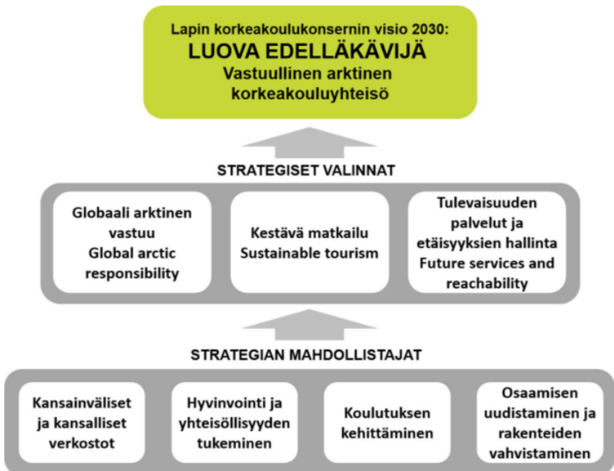
Kuvio 2. Lapin korkeakoulun strategia

Visio 2030: Luova edelläkävijä – vastuullinen arktinen korkeakoulu yhteisö