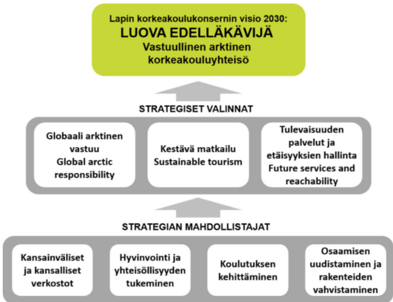
Kuvio 2. Lapin korkeakoulun strategia

Visio 2030: Luova edelläkävijä – vastuullinen arktinen korkeakoulu yhteisö