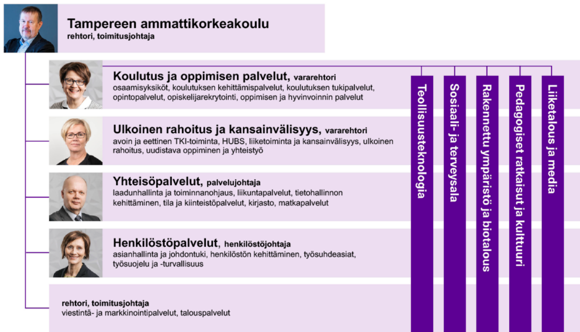
Kuvio 1. TAMKin organisaatiokaavio

Strategian päätavoitteet vastaavat suoraan kasvaviin yhteiskunnallisiin odotuksiin: